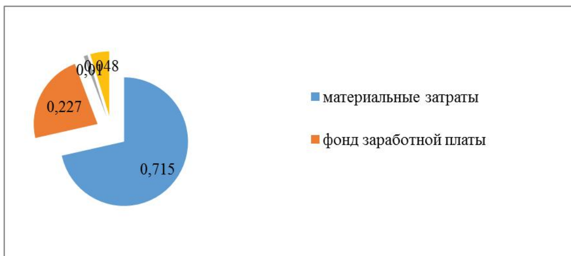
Рисунок 2 - Структура затрат на выращивание молодняка в хозяйствах, % (2019 г)

Наблюдается рост себестоимости 1 ц прироста, себестоимость прироста бычков ниже себестоимости прироста телок и более выше в группах зимнего сезона рождения.