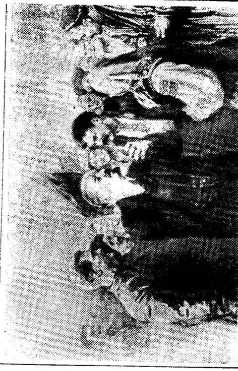
«В. И. Ленин — вдохновитель дружбы народов». Рис. художника Р. Резниченко.

секретарь ЦК КПСС Говардин А. И. Брежнев говорил: «Все мы, в какой бы республике мы ни жили, советские патриоты, дети одной социалистической Родины. Наша родная земля, Отчизна наша это немыслимые просторы, раскинувшиеся от Тихого океана до Балтийского моря, от Соверного Дежневского пролива до Памира и Кавказа. И все, что создано на этой земле руками людей, в промышленные города, гигантские промышленные комплексы и деревни, ценности духовной культуры — все это результат общего труда, наше общее достояние, достояние советского народа».