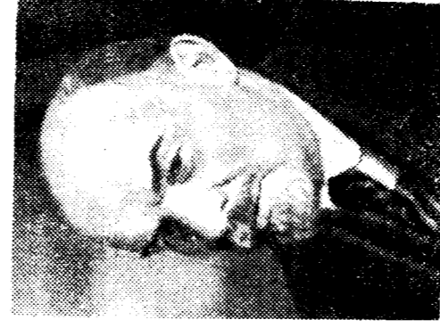
В. И. Ленин. Москва, 4 октября 1922 года.

ветской республики перекричавшиеся серд и молот как бы пронызывались мечом. Этот проект вызвал замечание Ленина. Сохранилась пометка Ильича на одном из документов: «Выкинуть из рисунка меч». Сейчас каждая из 15 союзных республик имеет свой герб. Наличие в них общих с Государственным гербом СССР элементов — сердца и молота — и общего девиза свидетельствует об органическом единстве советских республик. Изображенные на гербах серд и молот являются эмблемой мирного труда и отмечают, что СССР — это государство рабочих и крестьян, что власть в нем принадлежит трудящимся. Восходящее над земным шаром солнце символизирует светлое будущее человечества.