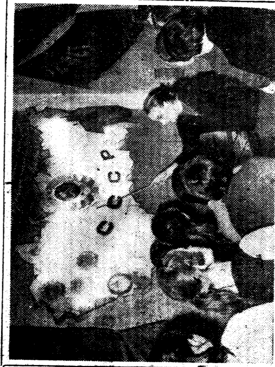
Москва. В одном из залов Центрального музея В. И. Ленина представлены документы и материалы, рассказывающие об образовании Союза Советских Социалистических Республик.